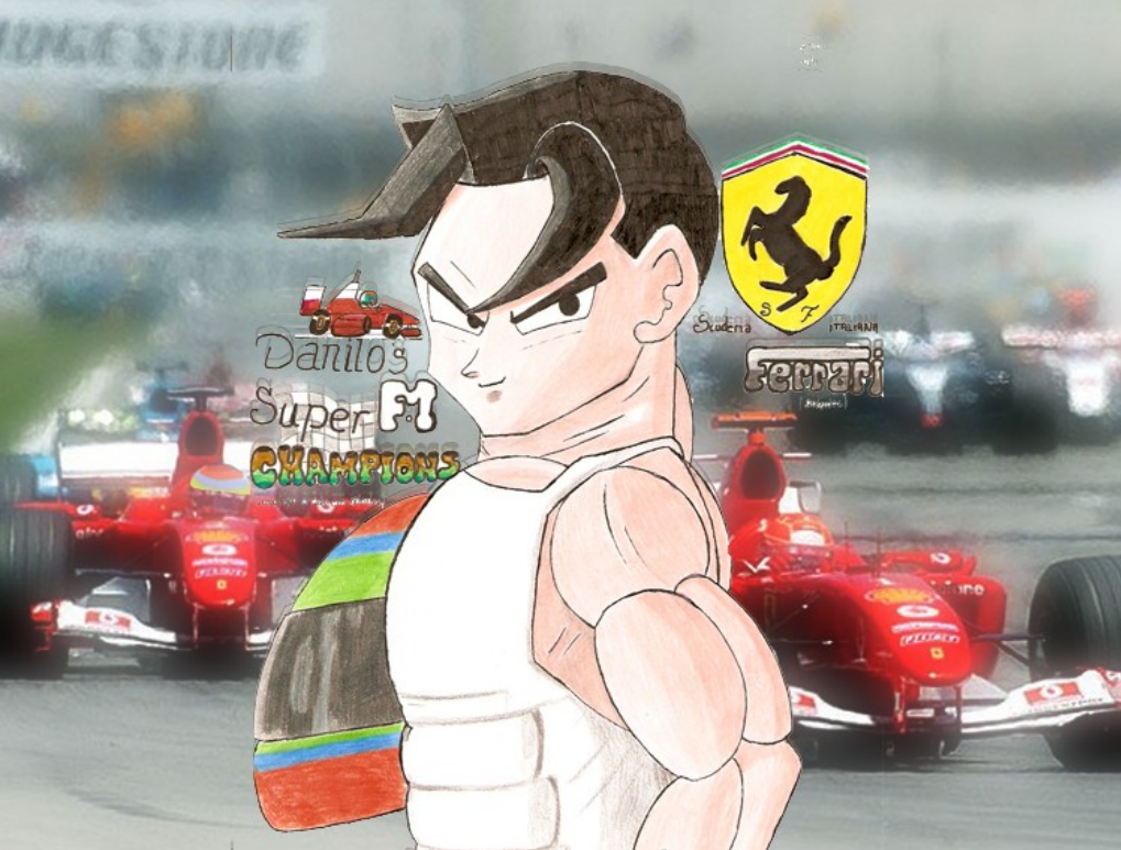
Danilo's F1 Super Champions